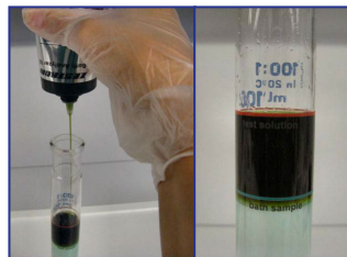
2) Testflüssigkeit zugeben