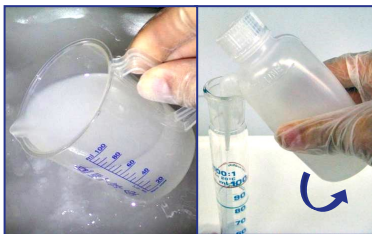
1) Probenentnahme / Umfüllen